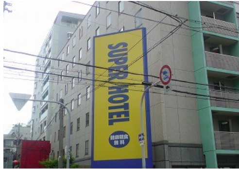
徹底したコスト削減とその費用をお客様に還元する ビジネスホテルチェーン「スーパーホテル」

皆様の店舗において、当たり前と思われるコストはないでしょうか？例えば、店舗のパソコン。安くなったパソコンと言っても、1台5万円～10万円の費用がかかります。1店舗にとって、5万円～10万円を稼ぐにはどれだけの労力があるのでしょうか。小さな店舗であれば、1日分の売上ぐらいです。結構大きな出費です。